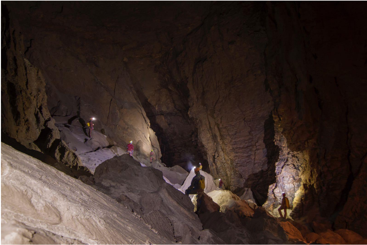
Grotta di Collalto