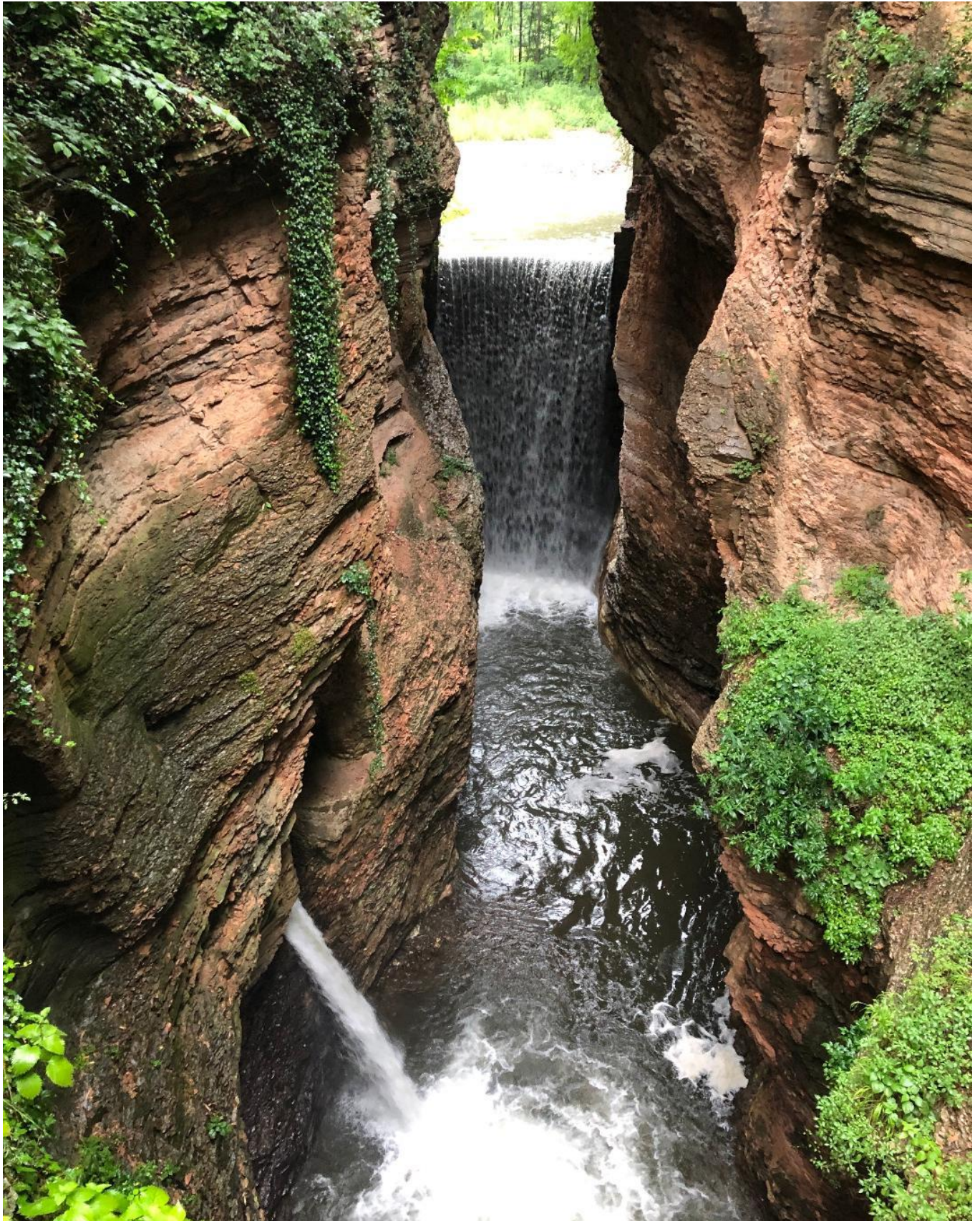
L'Orrido di Ponte Alto