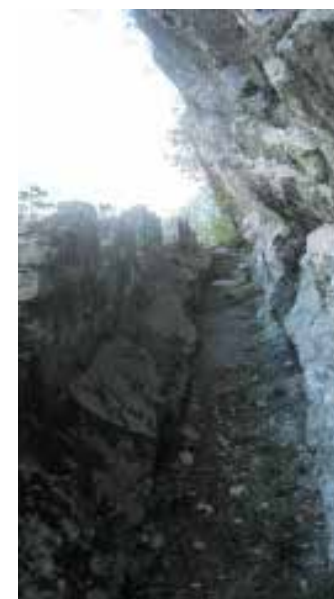
Trincea di vedetta